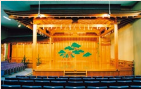
広島県福山市にある喜多流大島能楽堂舞台。1971年に改築された総檜造りの舞台。